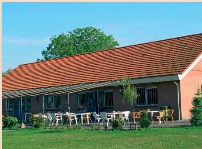
Een behoorlijk aantal kynologen clubs bezit een eigen clubhuis en/of een clubterrein, voorzien van een vergaderruimte en een bar.

Een behoorlijk aantal kynologen clubs bezit een eigen clubhuis en/of een clubterrein, voorzien van een vergaderruimte en een bar. Vrijwilligers zetten zich in om een clubhuis zo gezellig mogelijk te maken, terwijl 'handige jongens' het onderhoud plegen. Omdat veel activiteiten buiten plaatsvinden, is een clubhuis letterlijk en figuurlijk een schuilplaats voor kynologen. Sommige kynologen clubs verhuren hun clubhuis en/of clubterrein aan collega-clubs, die geen onderkomen hebben, of aan rasverenigingen, die er voor hun activiteiten gebruik van kunnen maken.