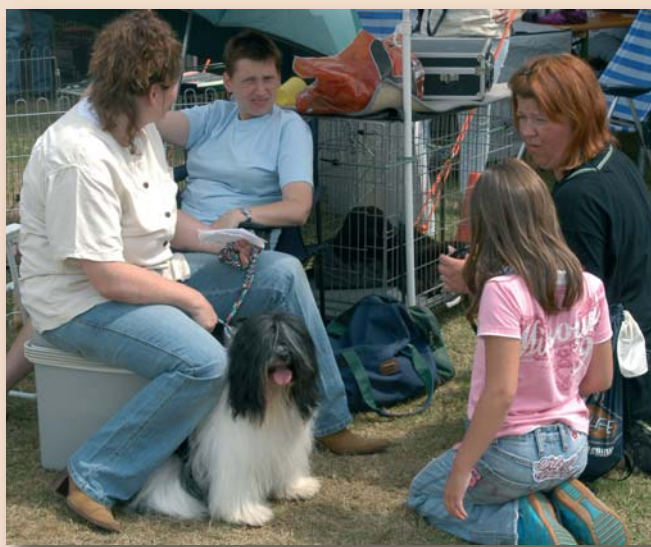
Liefhebbers van honden kunnen in clubverband kennis opdoen en in contact komen met andere hondenliefhebbers in de regio..

Het verschil tussen een kynologen club en een rasvereniging is dat een rasvereniging zich bezighoudt met de belangenbehartiging van meestal één ras, bij voorbeeld de Bouvier of het Kooikerhondje. Hun activiteiten hebben dan ook vrijwel altijd een directe link met het ras dat zij vertegenwoordigen. Wat een rasvereniging precies te doet, is te lezen in een andere brochure van de Raad van Beheer: “Wat is en doet een rasvereniging”.