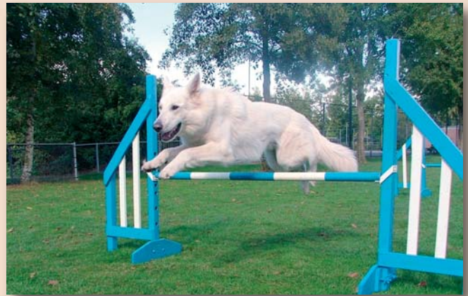
Witte Herder in actie. Behendigheid is nu een erkende wedstrijdssport.

Kynologen Clubs houden over het algemeen 1 x per jaar