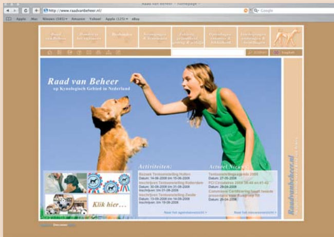
De website: www.raadvanbeheer.nl

verzorgde, maar vooral informatieve sites tegen, waarop men direct contact kan leggen met de kynologen club, voor een lidmaatschap of voor informatie.