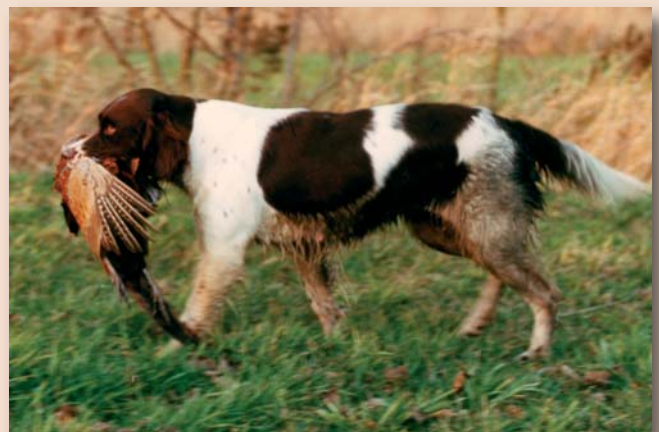
Jachtraining, het in goede banen leiden van natuurlijke aanleg

Er wordt wel eens gedacht dat een jachthondentraining alleen bedoeld is voor mensen die ook werkelijk jagen. Dat is een groot misverstand. Met jachthonden een jachtraining volgen, betekent eigenlijk het in goede banen leiden van hun natuurlijke aanleg. Jachthondentrainingen spelen zich buiten af, in de natuur, en dat alleen al geeft hond en baas veel plezier.