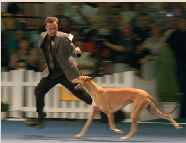
Kynologen Clubs organiseren ook clubmatches en tentoonstellingen.

Hét modernste communicatiemiddel is een website . Vrijwel iedere erkende kynologen club heeft er een. De adressen zijn te vinden op www.raadvanbeheer.nl . Evenals het clubblad, kennen websites vaste rubrieken: het programma dat de club biedt, de activiteitenagenda, tarieven, etc. Uitgebreide websites geven ook artikelen van dierenartsen, rasbeschrijvingen, etc. Dan zijn er nog de rubrieken die het onderlinge contact bevorderen, zoals een gastenboek, een fotoboek en een forum. Wie een beetje surft op internet, komt zeer professionele,