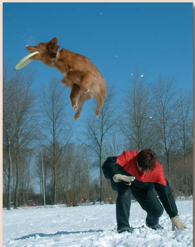
Frisbee is een sport voor kleine tot middelgrote honden. (Foto: Archief NSDTRCN).

• Cursus Ringmedewerker – De kynologie stoelt op duitzenden vrijwilligers, die bij evenementen behulpzaam zijn. Omdat op een tentoonstelling de bestaande regelgeving moet worden gevolgd, is er een cursus Ringmedewerker ontwikkeld die vrijwilligers opleidt voor de functies en werkzaamheden in en rond de showing.