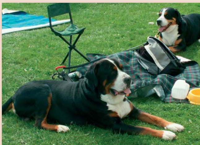
Bijna alle hondensporten hebben behalve een educatief ook een sportief en recreatief element.

De door de Raad van Beheer erkende Kynologen Club in uw regio is hét eerste aanspreekpunt voor alle vragen over hondenopvoeding, hondentraining en hondensport!