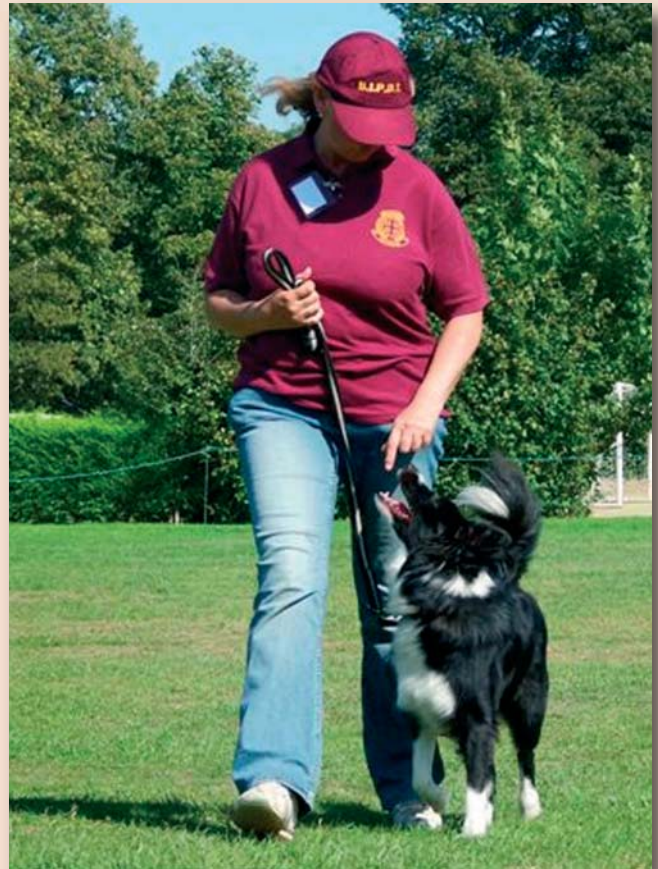
Gehoorzaamheidstraining. Met GG 1, GG 2 en GG 3 treden hond en baas de wereld van de 'echte' training binnen.