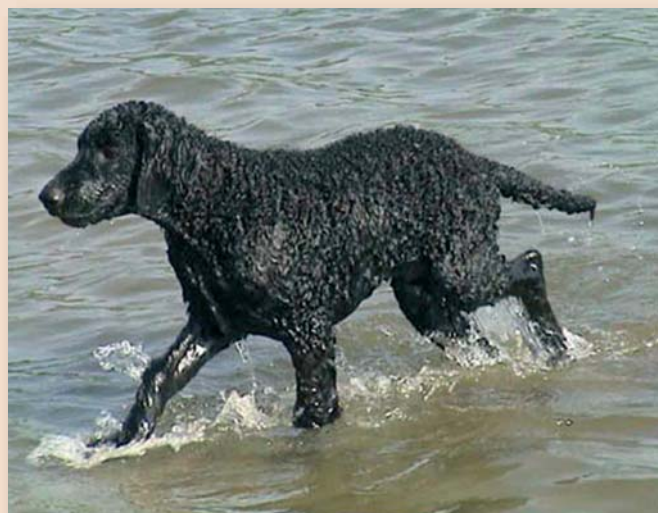
Curly Coated Retriever

op Kynologisch Gebied in Nederland’ of het logo ‘Raad van Beheer - Erkende Rasvereniging’. Om die erkenning te krijgen, moet aan een aantal voorwaarden worden voldaan. Deze voorwaarden zijn vastgelegd in het Kynologisch Reglement, kortweg KR, de wegwijzer in de georganiseerde kynologie. Het KR is te downloaden op www.raadvanbeheer.nl