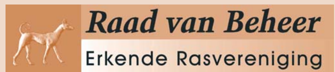
Logo Erkende Rasverenigingen

De eerste stap die moet worden gezet bij het aanschaffen van een rashond, is contact opnemen met de rasvereniging!