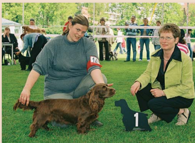
Clubmatch eerste plaats

Veel rasverenigingen zijn creatief in het bedenken van activiteiten voor de leden met hun honden. Welke activiteiten dat zijn, hangt ook samen met de aard van het