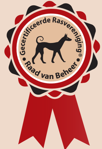
Logo gecertificeerde rasvereniging

ening ook duidelijk herkenbaar aan een door de Raad van Beheer verstrekt logo 'Gecertificeerde Rasvereniging'.