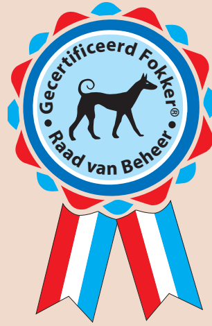
Logo gecertificeerde fokker

Als in de komende jaren de certificering van rasverenigingen een feit wordt, dan wordt een erkende rasver-