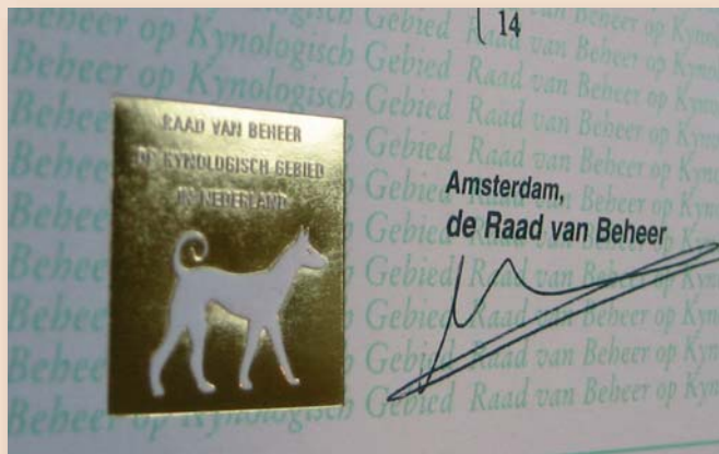
Bij een rashond hoort een stamboom, het officiële afstammingsbewijs

De fokkerij binnen een rasvereniging is veelal geregeld via het fokreglement van de betreffende club. In de nabije toekomst worden het Basis Stamboom Reglement (BRS) en het Rasspecifiek Fokreglement (RFR) – beide geïnitieerd door de Raad van Beheer – de uniforme basis voor het fokken van rashonden. Beide reglementen moeten worden gerespecteerd als men een gecertificeerde rasvereniging, respectievelijk gecertificeerde fokker wil zijn. De regels voor het BRS staan vast; het RFR kunnen de rasverenigingen, binnen bepaalde kaders, zelf invullen. Im-